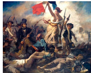
Eugène Delacroix: Die Freiheit führt das Volk